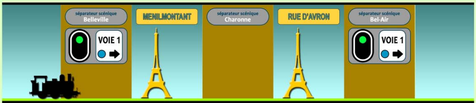
Engagement du Canton Belleville - Bel-Air