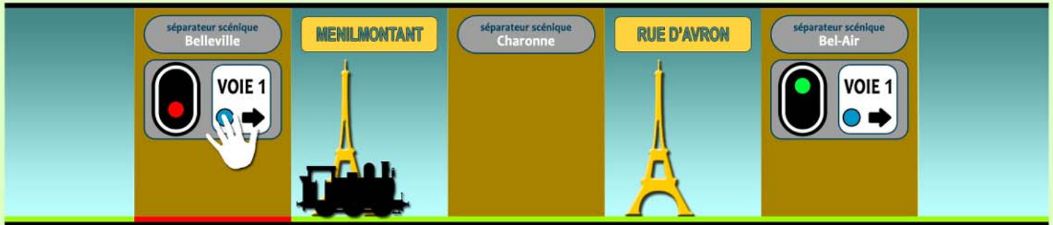
Dégagement de la zone de protection et action manuelle sur l'appareil de block