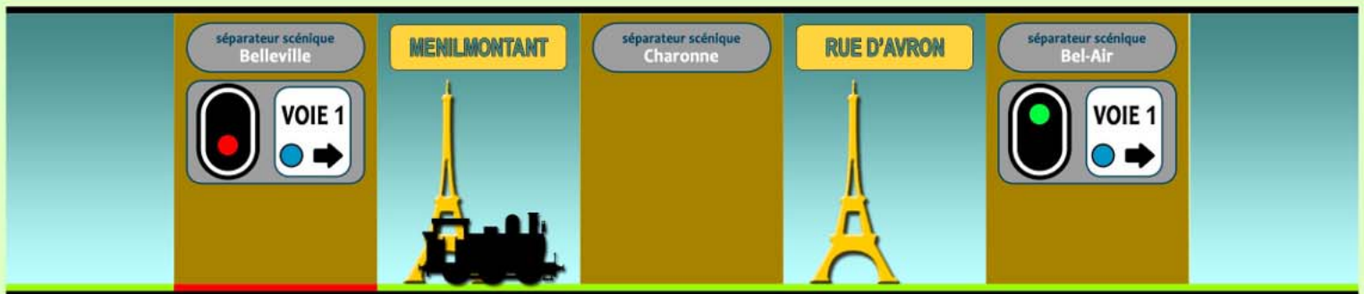
Circulation dans le canton Belleville - Bel-Air protégée par la fermeture du sémaphore de Belleville