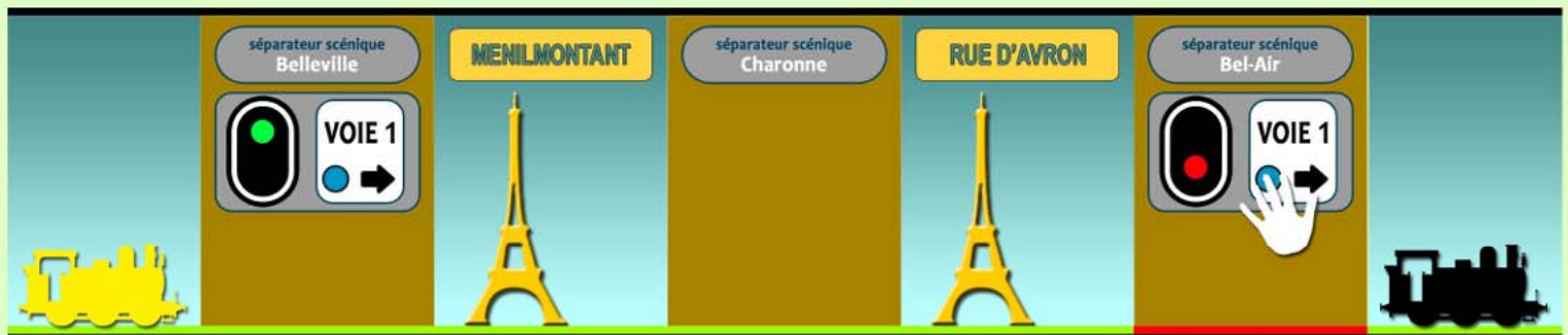
Dégagement de la zone de protection de Bel-Air et réédition Voie Libre sur l'appareil de block