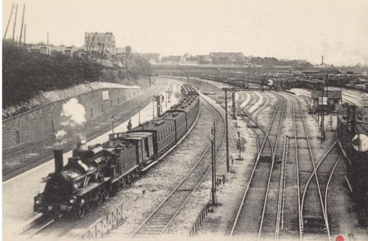
Vue de Conflans-Charenton, arrivée d'un Train à Bercy