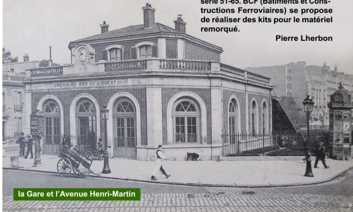
la Gare et l'Avenue Henri-Martin