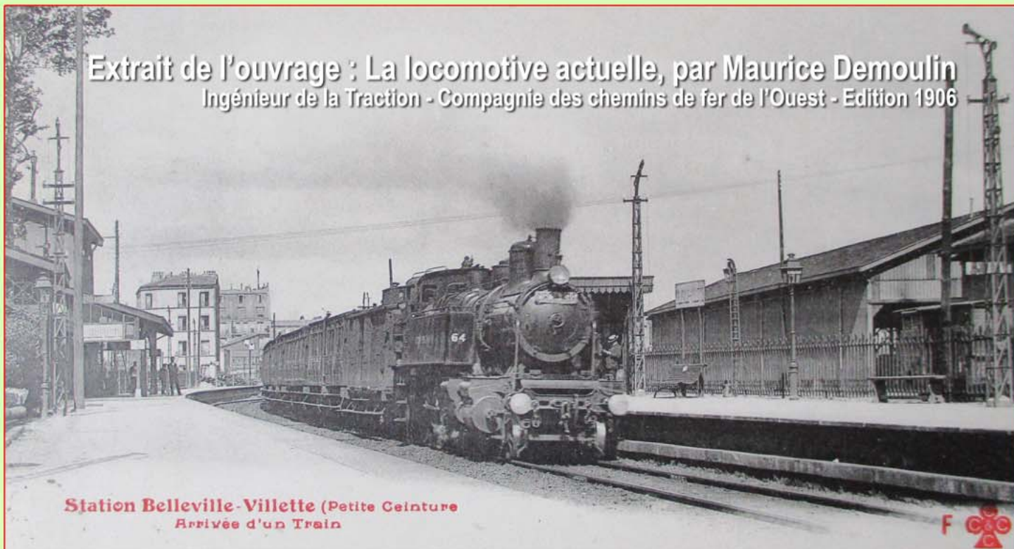
Station Belleville-Villette (Petite Ceinture) Arrivée d'un Train

Extrait de l'ouvrage : La locomotive actuelle, par Maurice Demoulin Ingénieur de la Traction - Compagnie des chemins de fer de l'Ouest - Edition 1906